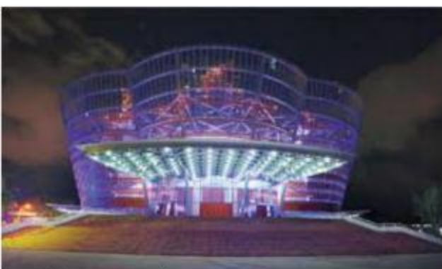
නෙළුම් පොකුණ රඟහල