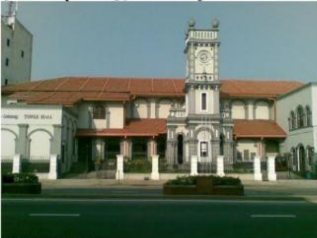
ටවර් හෝල් රඟහල