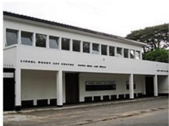
ලයනල් වෙන්ටඩ් රඟහල